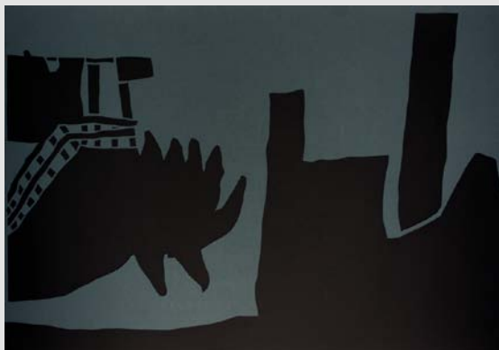
Deponija , 2012, kolaž, 70 × 100 cm

Živi in ustvarja na Belih Vodah (18a) nad Šoštanjem (3325 Šoštanj, Slovenija). http://uros-potocnik.webs.com/