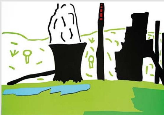
TEŠ , 2012, kolaž, 70 × 100 cm

Rodil se je leta 1974 v Slovenj Gradcu, leta 1994 končal srednjo šolo za steklopihalca/steklarskega tehnika v Rogaški Slatini, leta 2006 diplomiral na Akademiji za likovno umetnost in oblikovanje v Ljubljani - smer slikarstvo. Leta 2012 je opravil magistrski študij na Akademiji za likovno umetnost in oblikovanje v Ljubljani ("Fotoslika").