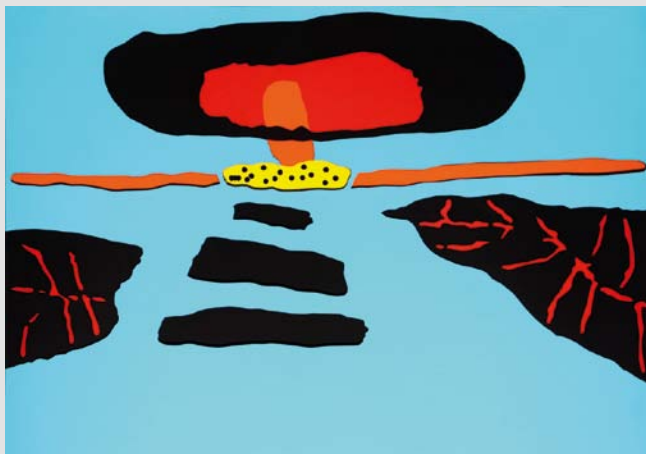
Bikini , 2012, kolaž, 70 × 100 cm